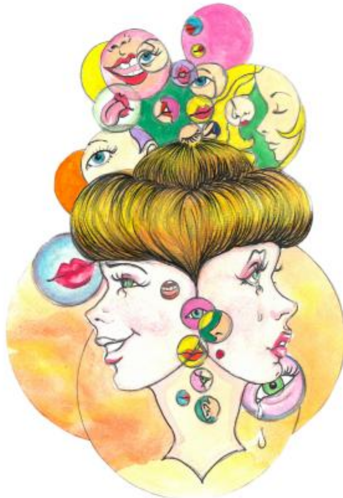
Ilustración: Ana Costas