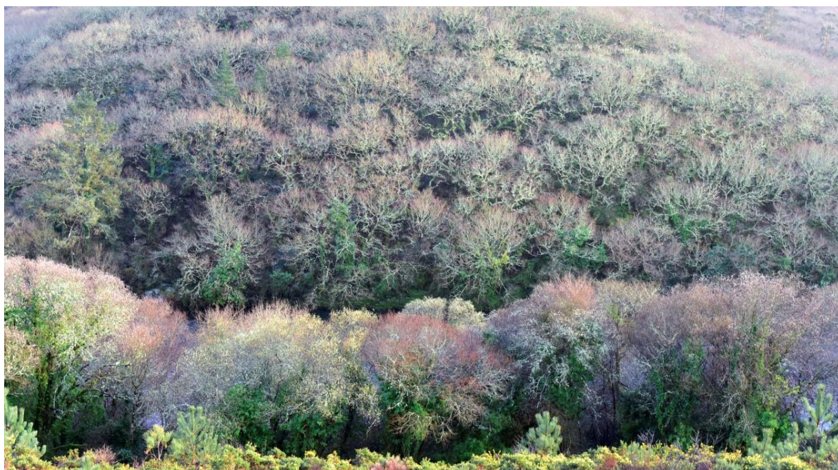
A verdallar na devesa de Anllares